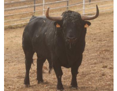
Nº 35 MALVARROSO