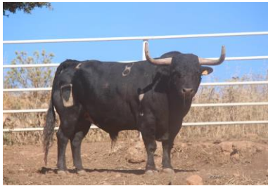
Nº 8 MACUREÑO