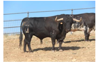
Nº 9 PICADILLO

GUARISMO: 7 (11/16) NEGRO SALPICADO BRAGADO