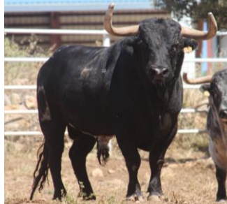
Nº 25 LIMONERO