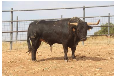
Nº 5 DUDITO

GUARISMO: 7 (11/16) NEGRO SALPICADO BRAGADO